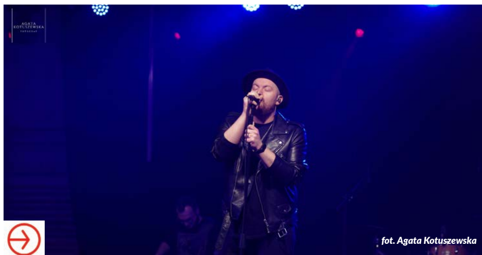
fot. Agata Kotuszewska